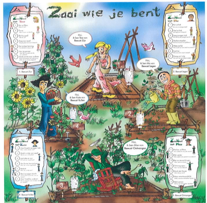
De ZaaiGoed poster

"Anders kijken, anders luisteren, anders doen: sociaal emotioneel versterken met ZaaiGoed!"